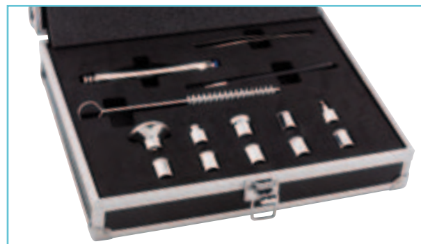
Koffer mit verschiedenen Aufsätzen und Reinigungsutensilien